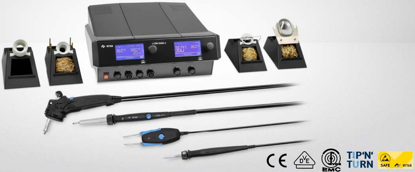
i-CON VARIO 4 MK2 mit X-TOOL VARIO, i-TOOL AIR S, CHIP TOOL VARIO & i-TOOL MK2